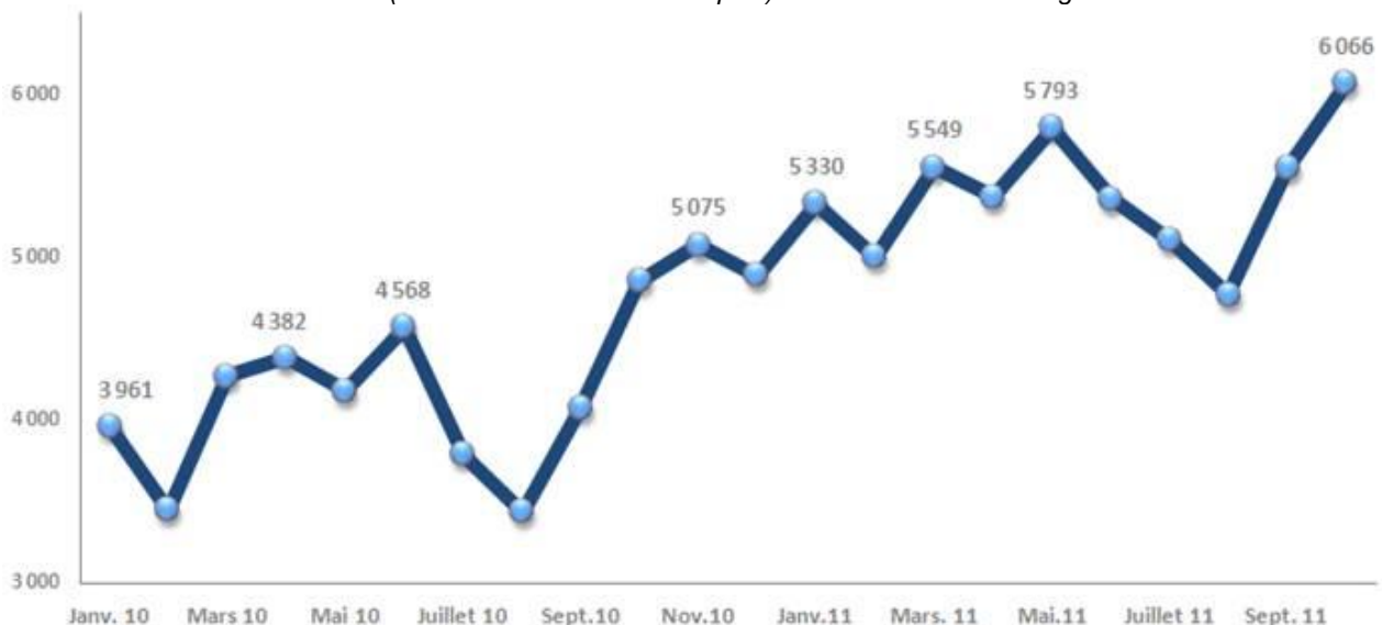
Audience mensuelle (en milliers de Visiteurs Uniques) – Mediametrie NetRatings octobre 2011

Dans un traitement 100% web proposant à la fois du texte, de la photo, de la vidéo, du live et de l'interactivité , le site 20minutes.fr met chaque jour tout en œuvre pour proposer un contenu pertinent répondant aux attentes de ses internautes.