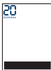
bandeau de Une L 210 x H 35