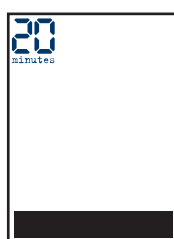
bandeau de Une L 210 x H 35