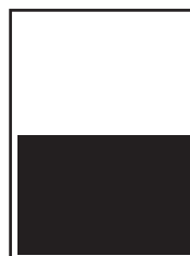
1/2 page largeur L 210 x H 130