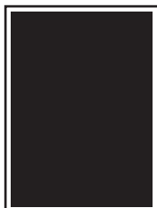
page L 210 x H 280