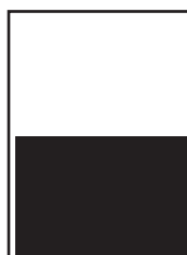
1/2 page largeur L 210 x H 130