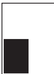
1/4 page hauteur L 103 x H 130