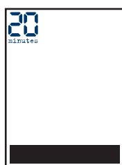
bandeau de Une L 210 x H 35