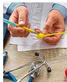
La vasectomie permet de bloquer le cheminement des spermatozoïdes.

En 2014, j'en faisais une ou deux par mois. En 2021, je suis autour de 25 par mois. Et ça se confirme au niveau national : de 2017 à 2018, on est passé de 4800 à près de 10 000 opérations. Il y a une demande sociétale des hommes qui émerge.