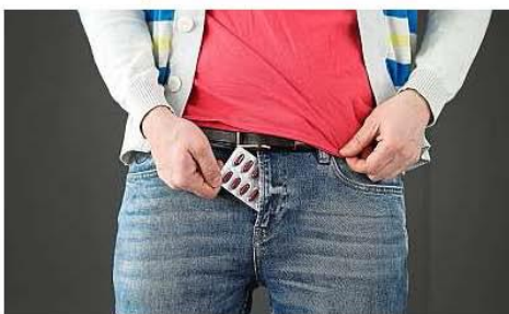
Huit jeunes sur dix estiment normal de partager la responsabilité de la contraception.

S'ils se sentent bien informés sur la contraception féminine (74 %), ils se disent beaucoup moins renseignés sur la contraception masculine (44 %). Et très peu utilisent une autre